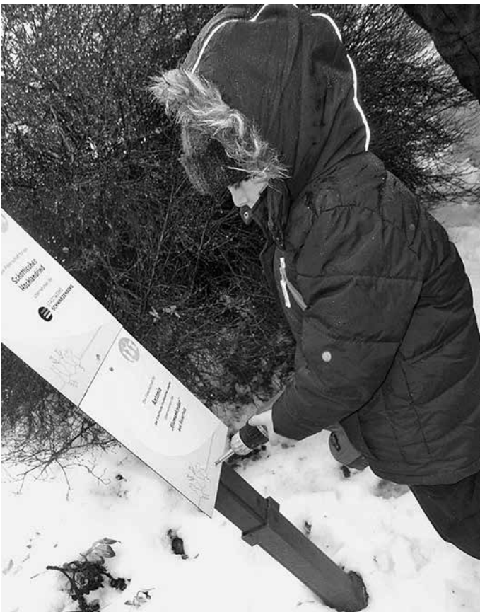
Selbst ist der Mann.

Unser Förderverein des Natur- und Wildparkes Waschleithe e.V. freut sich sehr über das Interesse und die Begeisterung der Kinder und bedankt sich hiermit im Namen der Vereinsmitglieder für die Unterstützung.