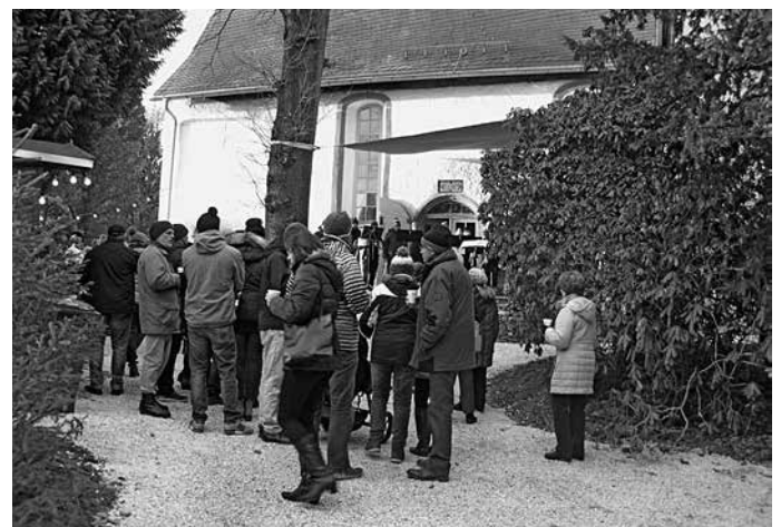
Bei Glühwein und Bratwurst lauschten die Besucher den weihnachtlichen Darbietungen.

Weihnachtlich geschmückt, bot die Peter-Pauls-Kirche am Pfarrweg auch in diesem Jahr eine schöne Kulisse für den Beierfelder Weihnachtsmarkt. Vor und in der Kirche gab es weihnachtliche Darbietungen; örtliche Vereine und Gewerbetreibende versorgten die Weihnachtsmarktbesucher mit süßen und herzhaften Leckereien.