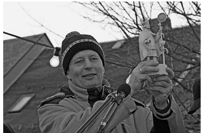
Ein besonderer Preis für einen ungewöhnlichen Wettbewerb