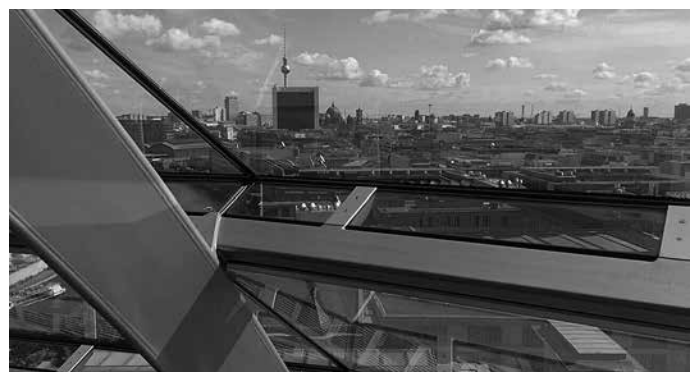
Blick vom Reichstagsgebäude