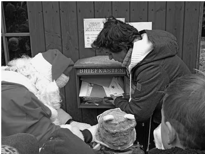
Am 1. Advent wurde der prall gefüllte Wunschbriefkasten am König-Albert-Turm geleert.

Rechtzeitig vor dem Fest wurden alle drei roten Wunschbriefkästen geleert. Viele Kinder aus der Spiegelwaldregion waren mit dabei, als der Weihnachtsmann die Wunschpost auf dem Spiegelwald, im Natur- und Wildpark und am Schaubergwerk in Waschleithe abholte. Über 250 Karten gingen in diesem Jahr auf die Reise. In der Weihnachtspostfiliale herrscht jetzt Hochbetrieb; es gibt viel zu tun. Denn jedes Kind hofft erwartungsvoll auf Post vom Weihnachtsmann.