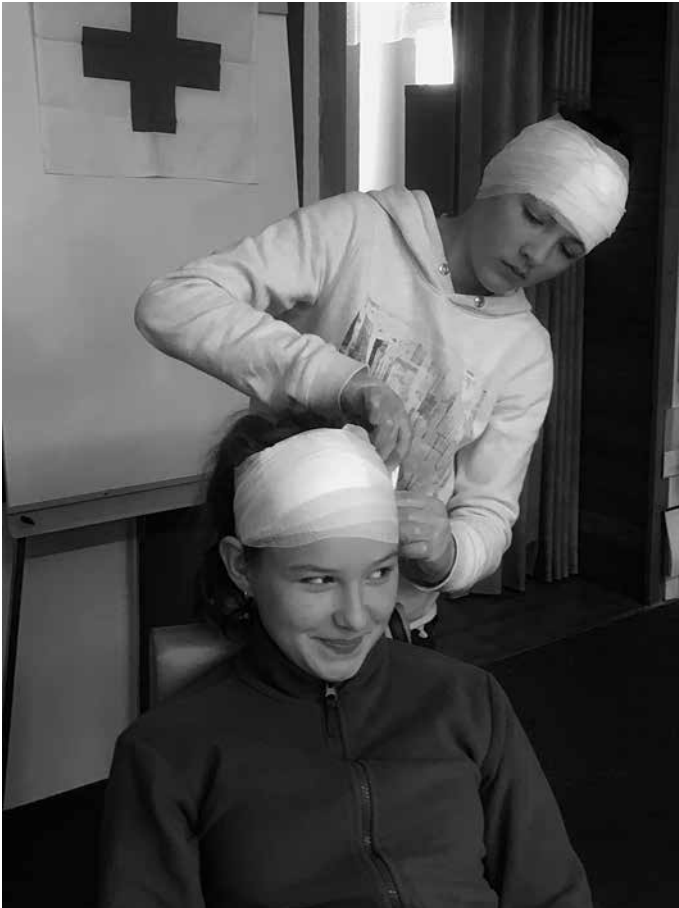
Auch ein Kopfverband muss richtig sitzen.