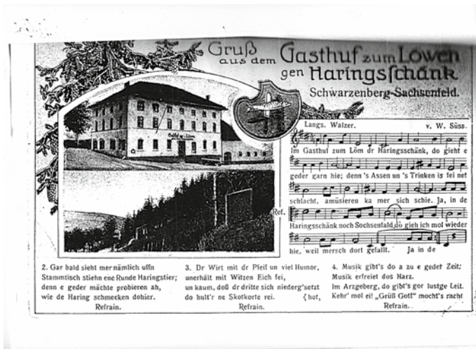
Gruß aus dem Gasthof „Zum Löwen“