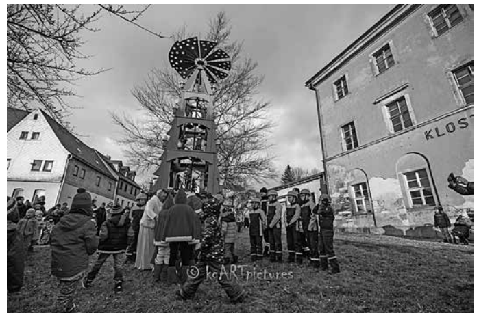
jetzt dreht sich die Grünhainer Pyramide wieder.