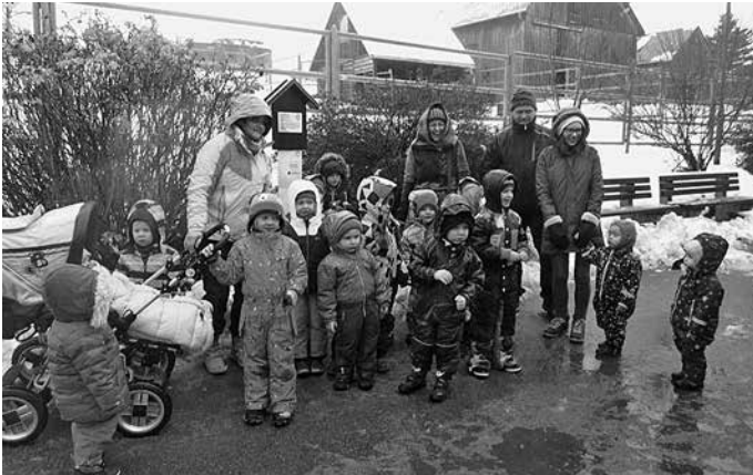
Auf diesen Besuch hatten sich die Blumenkinder lange gefreut.