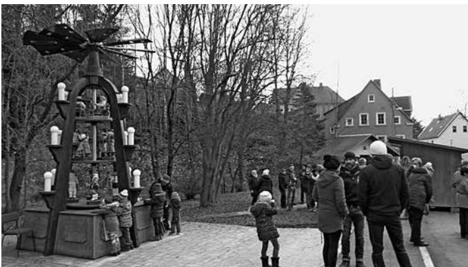
Zum Weihnachtsauftritt in Waschleithe traf sich Jung und Alt an der Ortspyramide.

Ein Dank den Sponsoren der Weihnachtsbäume in den Stadtteilen Beierfeld und Grünhain.