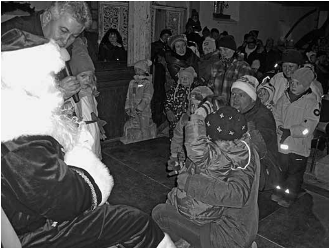
Viele Kinder waren gekommen, um den Weihnachtsmann zu treffen.

Allen Erzieherinnen der Kindereinrichtungen, der Tanzgruppe der Grundschule und dem Chor der Oberschule ein großes Dankeschön für die gelungenen Weihnachtsprogramme. Die Posaunenchor und die Bernsbacher Musikanten stimmten mit musikalischen Weisen auf Weihnachten ein. Die Kameraden der örtlichen Feuerwehr Grünhain, die Elektrofirmen Wurlitzer und Ziemert, die Fa. Klotz, die Fa. Barthel, Familie Hüller, Fa. Sicherheitstechnik Bethke und die Mitarbeiter des Stadtbauhofes übernahmen die weihnachtliche Beleuchtung und Ausschmückung.