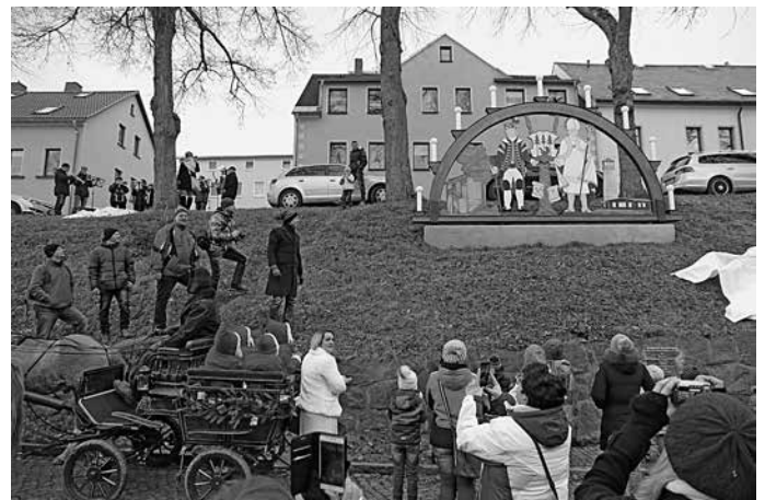
Alle Weihnachtsmarktbesucher bestaunten das neue Grünhainer Schmuckstück.

Auf dem Markt gab es dann wieder ein buntes Programm von der Maulwurfgruppe der Kita Klosterzwerge um Erzieherin Laura Weigel, unserem Posaunenchor, dem Spiegelwaldensemble und der Disco „Käfer“.