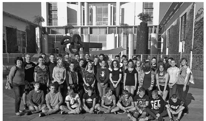
Vor dem Bundeskanzleramt

Wir, die Klassen 10 der Oberschule Grünhain-Beierfeld, waren vom 4. bis 7. September 2017 in der Hauptstadt Berlin. Etwas aufgeregt waren wir schon, als es am Montagfrüh losging. Trotz des zeitigen Aufstehens waren alle hellwach, stand uns doch eine ereignisreiche Woche bevor. Wir erlebten unheimlich viel. Besuche des Reichstagsgebäude, in dem jetzt der Bundestag sitzt, sowie des Kanzleramts waren genauso beeindruckend wie der Blick auf Berlin von Reichstagskuppel und Fernsehturm. Am Mittwoch ging es ins STASI-Gefängnis Hohenschönhausen, wo uns ein Zeitzeuge durch die Räume führte. Er hat uns durch Fragen, die ihm damals auch gestellt wurden, richtig mit einbezogen und uns das Gefühl gegeben, in die Zeit zurückversetzt zu sein. Alle waren sehr schockiert, wie man durch wenige Fragen und völlige Isolation die Meinung eines Menschen vollkommen verändern kann. Aber auch der Spaß kam nicht zu kurz. Madame Tussauds Wachsfiguren, der Filmpark Babelsberg oder Berlin Dungeon waren coole Aktionen. Jeder konnte hier nach seinen Interessen sich beschäftigen. Es entstanden jede Menge Fotos und bleibende Erinnerungen. Das Highlight jedoch bleibt der Besuch der Show „Blue Man Group“. Nach vielen Kilometern zu Fuß sowie im Bus in Berlin-Ost/West, in Potsdam-Babelsberg waren alle sehr müde und geschafft. Anstrengende, aber schöne Tage liegen hinter uns. Danke den zwei Vatis, den Klassenlehrerinnen sowie dem Busfahrer, die alle für uns die Fahrt realisierten.