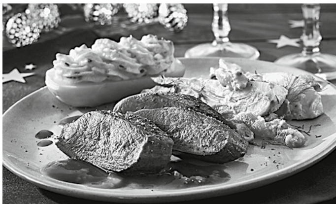
Entenbrust mit Fenchel-Aprikosengemüse (Rezept aus der Dr. Oetker Versuchsküche)