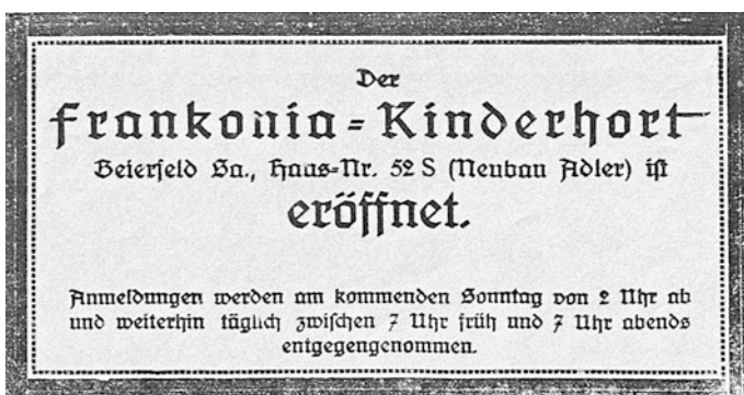
Bekanntmachung zur Anmeldung der Kinder in den Kinderhort – (Bekanntmachung aus dem „Erzgebirgischen Volksfreund“ vom 06.01.1917)

Im Jahr 1916 erfolgte am Ostflügel ein Erweiterungsbau der Stanzeri. Seit Oktober 1916 bestand ein Werkskindergarten für die in der Rüstungsindustrie stark beschäftigten Mütter. Auch ein Kinderhort wurde 1917 im Haus Ortsl.-Nr. 52 S (August-Bebel-Straße 142) eingerichtet. Im Jahr 1917 beschäftigte die Firma 1247 Arbeiter und Angestellte.