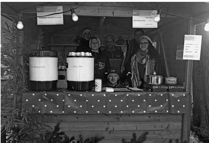
Die Mitglieder des Ortsvereins und Jugendrotkreuzes vor dem Start.

Auch dieses Jahr war der Weihnachtsmarkt eine gelungene und attraktivere Bereicherung des Vereinslebens in Beierfeld. Hiermit möchten wir uns bei allen Organisatoren und Mitwirkenden herzlich bedanken.